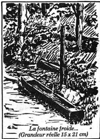
de Tross La fontaine froide... (Grandeur réelle 15 x 21 cm)

Paysages bien de chez nous, par un artiste bien de chez nous aussi, ces planches raviront tous ceux qui aiment à la fois les beaux dessins et la nature qu'ils copient, non servilement, mais en soulignant tout ce que sa contemplation peut moralement nous apporter. Une série de planches en noir et blanc à laquelle on souhaite tout le succès qu'elle mérite. (ec)